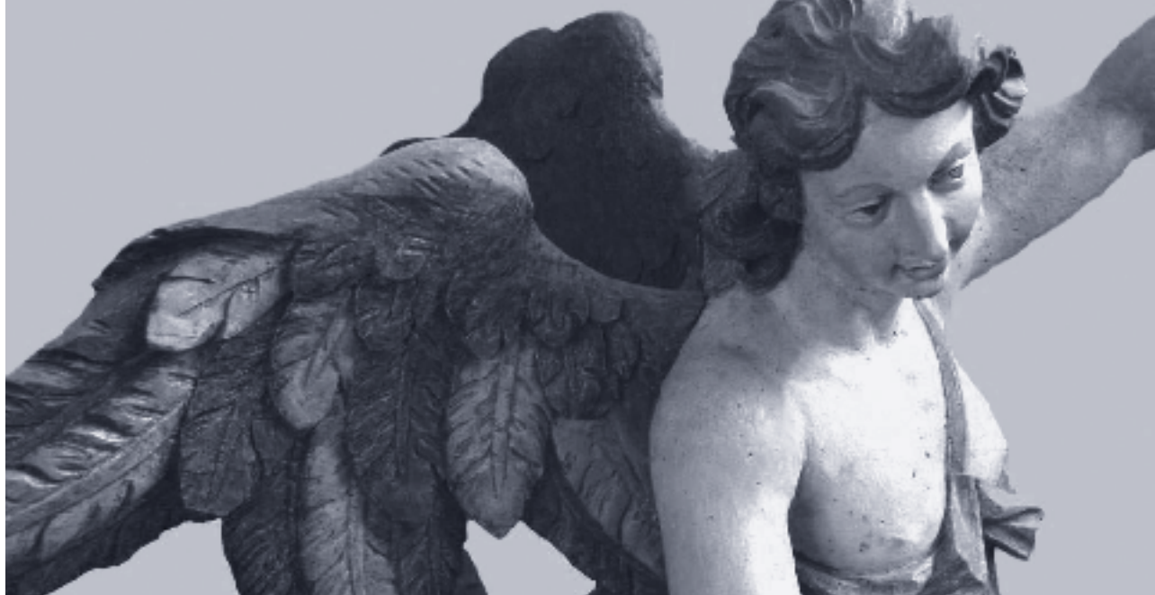
Barocker Taufengel der Kirche in Dahlen (KK Elbe-Fläming), mit Hilfe einer großzügigen Spende durch die KSKK restauriert.