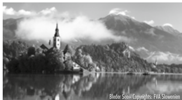
Bleder See

Während der Informationsreisen erleben Sie eine gesellige Atmosphäre, einem offenen Austausch unter den Mitreisenden und erhalten sachdienliche Informationen für die mögliche Planung einer Studienreise für Ihre Zielgruppe. Reisen Sie binnen drei Jahren mit uns in das gleiche Land mit mindestens 21 Personen, erstatten wir Ihren Kostenanteil.